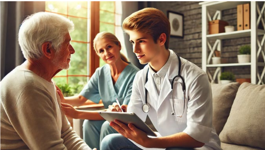
So stellt sich künstliche Intelligenz den Wissenstransfer bei der Spitex vor.

Wichtig ist, dass solche Innovationen nicht die persönliche Betreuung der Kundinnen und Kunden gefährden – die menschliche, persönliche Begegnung und Betreuung bildet seit jeher den Kern der ambulanten Pflege.